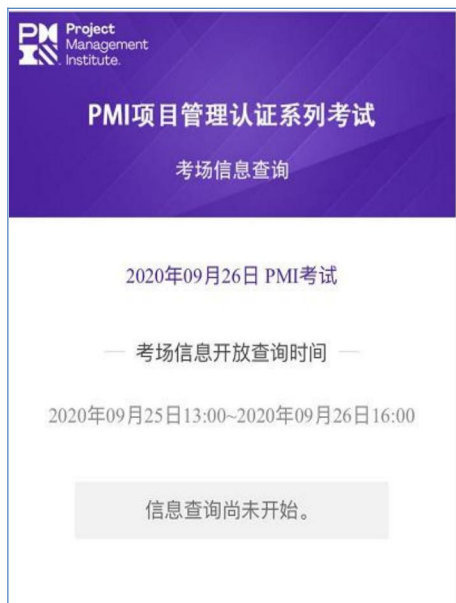
(图三 信息查询尚未开放)