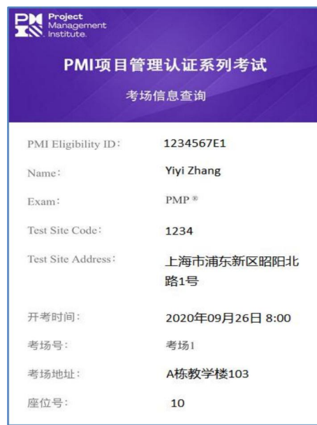
(图二 考场信息查询界面)