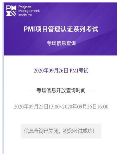
(图四 信息查询已关闭)